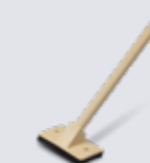
OS1379 Rengöringsborste med handtag för heta ytor*