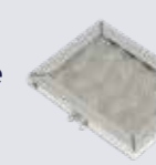
OD8130 Fettfilter nätfiler av rostfritt stål